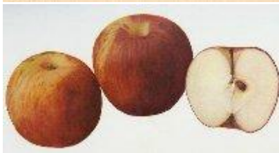
Apples of New York-1905-SA BEACH. Merci Alain Rouèche.