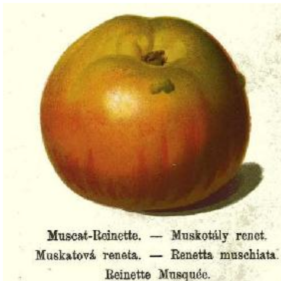
R.Stoll 1888 Pomologie en Autriche.